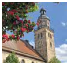
Unser Titelbild: Laurentiuskirche in Altdorf

Diakonin Jutta Krach und das Redaktionsteam