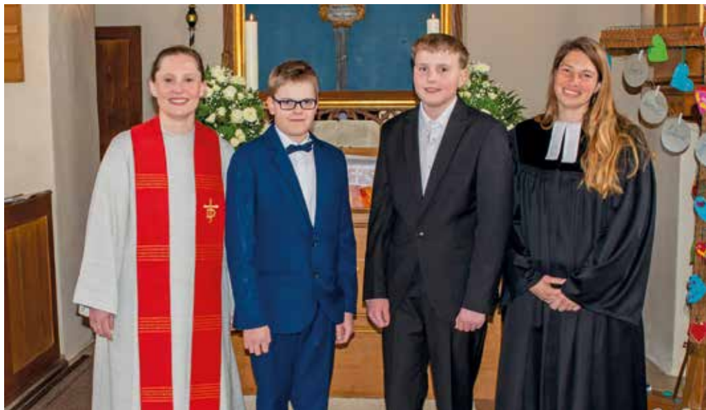
29. März Eismannsberg