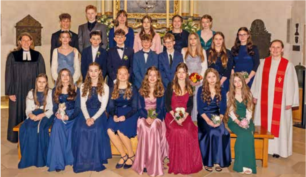
25. April Altdorf